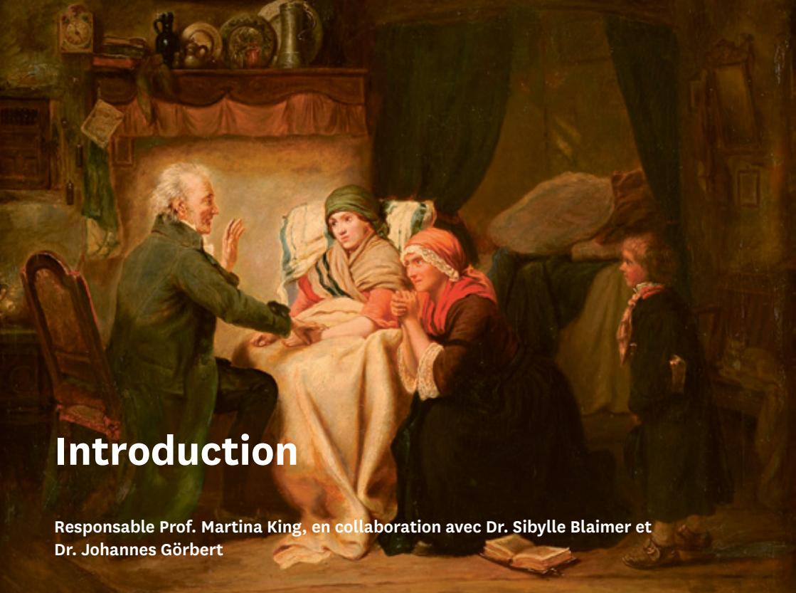
Carl Wilhelm Hübner, Der Landarzt, 1864. Öl/Lwd.